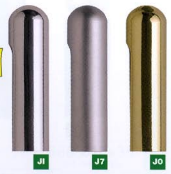
847 Ø14x34 art. 030/055 Ø13