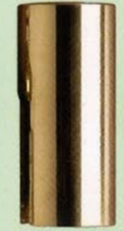
871 Ø18x31 art. 320 Ø16