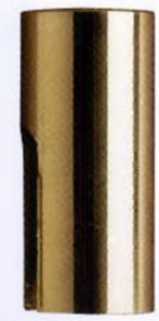
871 Ø22x49 art. 320 Ø20