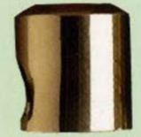
872 Ø22x24 art. 320 Ø20