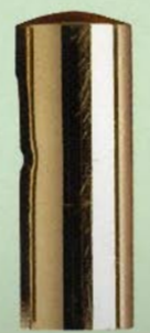
861 Ø17x47 art. 100/101 Ø15