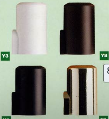
815 Ø15,8x26 art. 030/055 Ø14