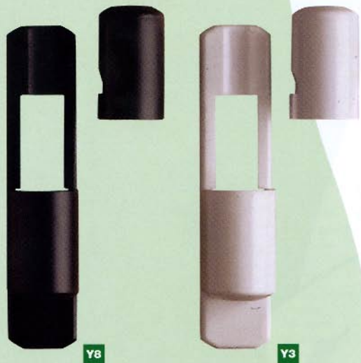
815 Ø14,5x70 art. 030/055 Ø13 - P09 Ø13