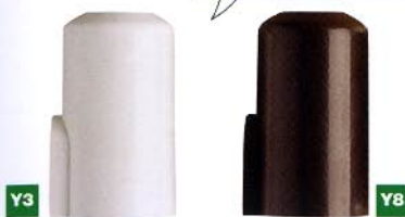
815 Ø17,5x32 art. 030/055/057 Ø16