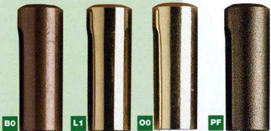
838 Ø18x49 art. 495 Ø16 Exacta