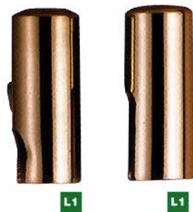
811 Ø14x35 art. P09/P39