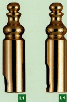
809 Ø14x55 art. P09/P39