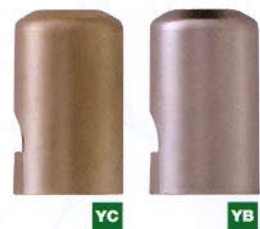
815 Ø14,5x24 art. 030/055 Ø13