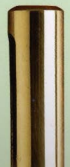
898 Ø18x54 art. 499 Ø16 / Q15 Ø16