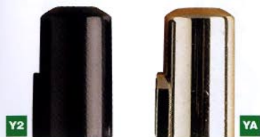
818 Ø15x35 art. P09/P39