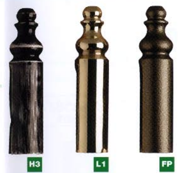
846 Ø15 X 45 art. 495 Ø 14 Exacta